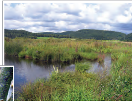
Naturschutzgebiet „Schmiechener See“