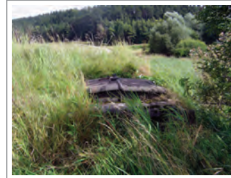
Widder im Siegental