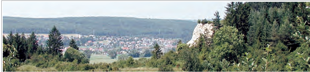
Hausener Blick auf Allmendingen

Vom Bahnhof aus gehen wir in Richtung Rathaus in die Hauptstraße und rechts weiter bis in die Ehinger Straße. Am Friedhof führt uns der Weg entlang des Gewerbegebietes vorbei ins Allmendinger Ried.