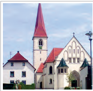
Pfarrkirche St. Maria, 15. Jahrhundert

Am Freyberg'schen Schloss und Rathaus vorbei, gelangen wir wieder zum Ausgangspunkt Bahnhof.