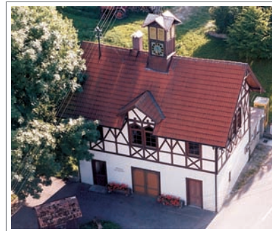
Rathaus in Grötzingen