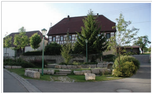
Ennahofen, Dorfplatz mit Gasthaus Hirsch

Ein bequemer Waldweg führt uns zurück zum Ausgangspunkt Weißes Kreuz.