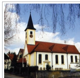
Kirche St. Stephanus in Schwörzkirch