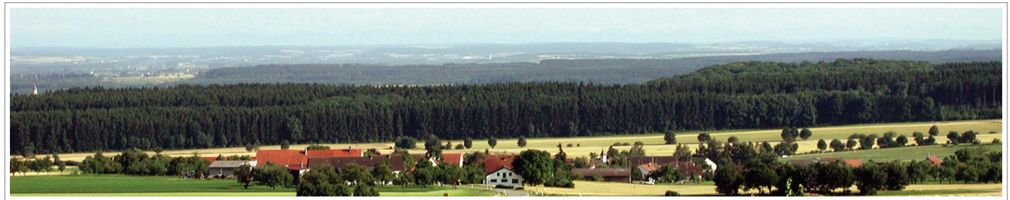
Blick vom Hochsträß-Panoramaweg auf Oberschwaben / Alpen