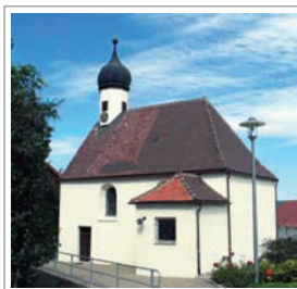
Kapelle in Hausen

Der ehemalige Kirchenweg führt uns durch das Naturschutzgebiet „Hausener Berg“ zurück nach Allmendingen.