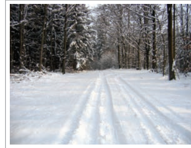
im Winter über den Häulesberg