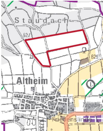
Abb. 1: Ausschnitt aus der RNK der Gesamtfortschreibung des Regionalplans Donau-Iller

Im Regionalplan existieren keine entgegenstehenden Festlegungen für die Planfläche. Im Rahmen erweiterter Planungshinweise ist das Gebiet mit geringem Konfliktpotential bei der Planung von großflächigen PV-Anlagen eingeordnet.