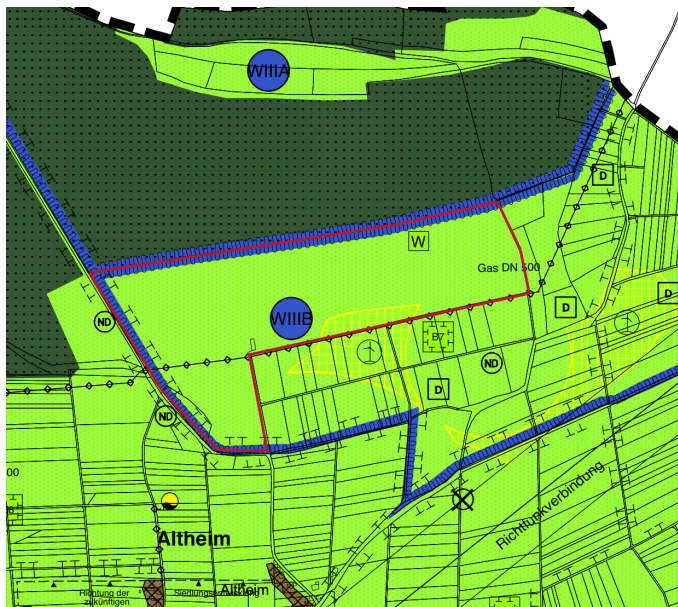
Abb. 3: Ausschnitt FNP VG Allmendingen-Altheim, 1. Teilfortschreibung Gewerbe+Energie (2021)

In der derzeit gültigen 1. Teilfortschreibung des Flächennutzungsplanes 2015 der VG Allmendingen-Altheim (wirksam seit 19.03.2021) wird das Plangebiet im wesentlichen als landwirtschaftliche Fläche dargestellt. Im südlichen Teil liegt ein Teil des Geltungsbereichs in einer „Vorrangfläche zur Nutzung von Windenergie“. Im Westen des Geltungsbereichs verläuft außerdem eine Hauptversorgungsleitung „Gas“ durch das Gebiet.