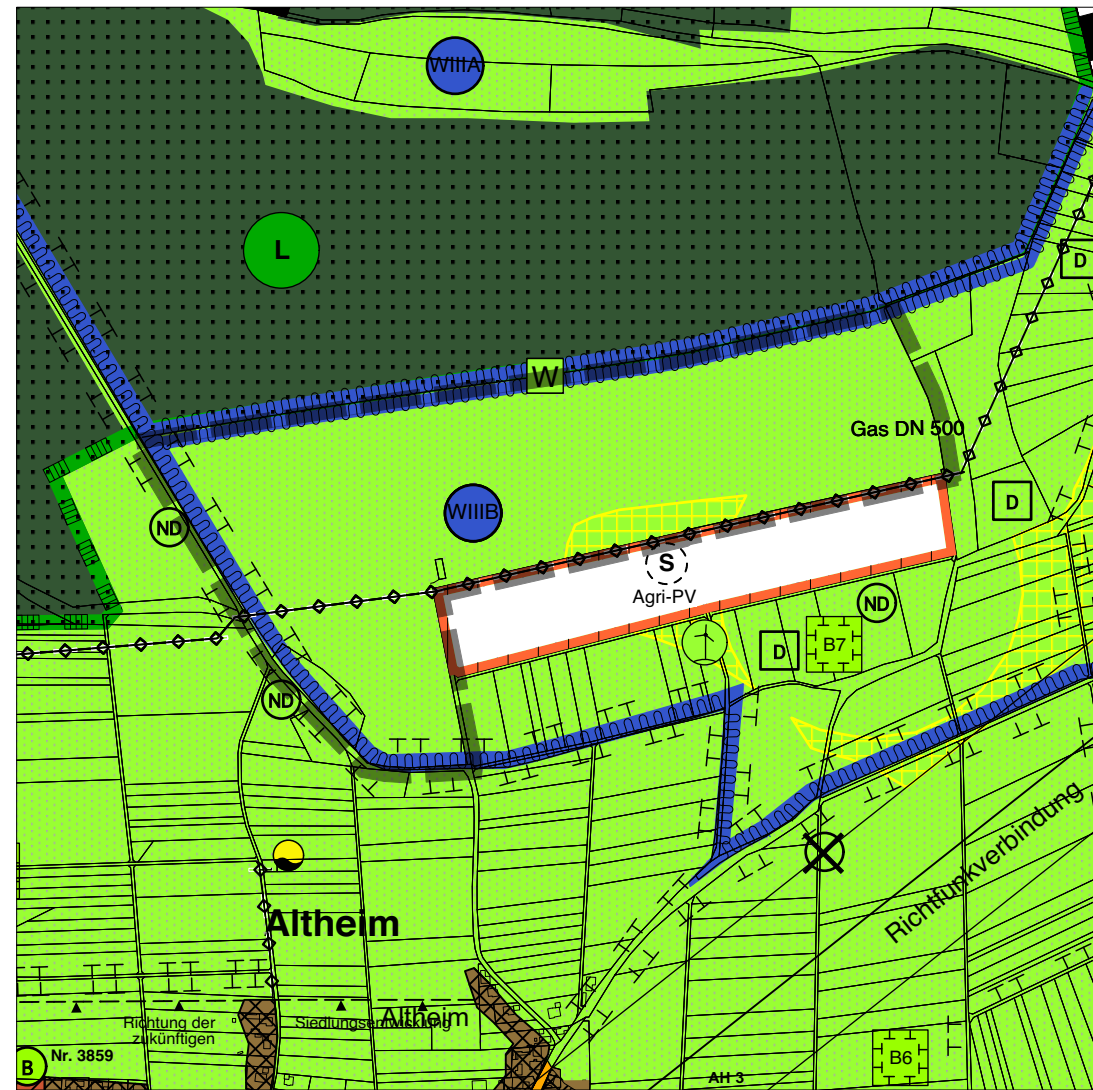
Planänderung (mit Abgrenzung in Verfahren befindlicher 1. Änderung)