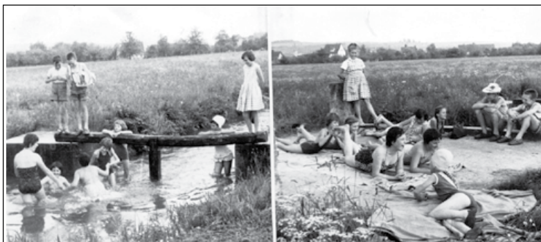
1962 an der Schmiech bei Allmendingen

Bis es in Allmendingen ein Schwimmbad gab, erfreuten sich die Badeleidenden in der Schmiech. Ein Gehintipp war der Treffpunkt an „dr eiserna Bruck“ im oberen Tal oder an einem, noch reichlich vorhandenen Fallenstock.