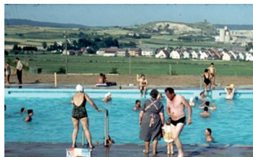
1964 - als Großmutter noch am Beckenrand über die Enkel im Wasser wachte.

Bereits 1933 reifte der Plan in Allmendingen ein Schwimmbad zu bauen. Im Allmendinger Ried entstand zwar ein Becken mit den Maßen 8 x 12 Meter. Aber aus dem Vorhaben wurde nichts. Politische Umstände in der Gemeinde und das fehlende Geld führten schließlich dazu, dass der Bau eingestellt wurde.